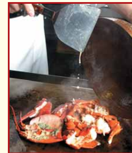
1. 龍蝦斬件，用牛油起鑊，將龍蝦略煎後用蓋焗一焗。