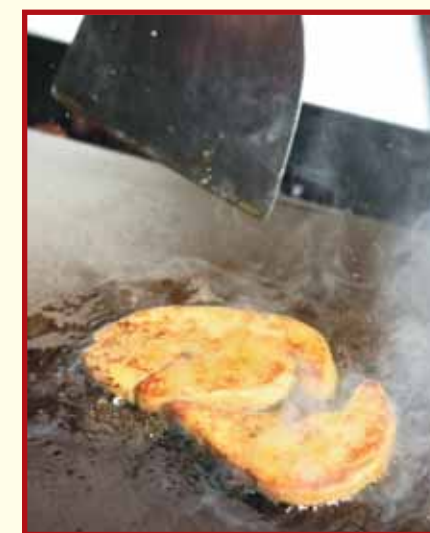
3. 鵝肝落鑊，每一面煎10秒。