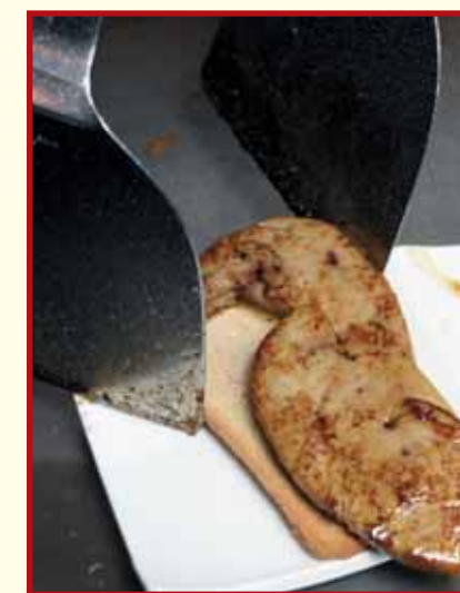
4. 煎香後，鵝肝上碟即成。

己可以有很多創意，廚藝沒有局限的規囑，要多嘗試，多參考別人的作品，去豐富自己的靈感。