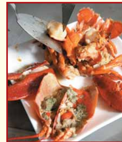
2. 龍蝦煎熟即可上碟。