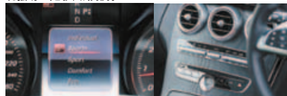
开启了 Sport + 行车模式，动力表现全面破解封印，行车表现更强劲。