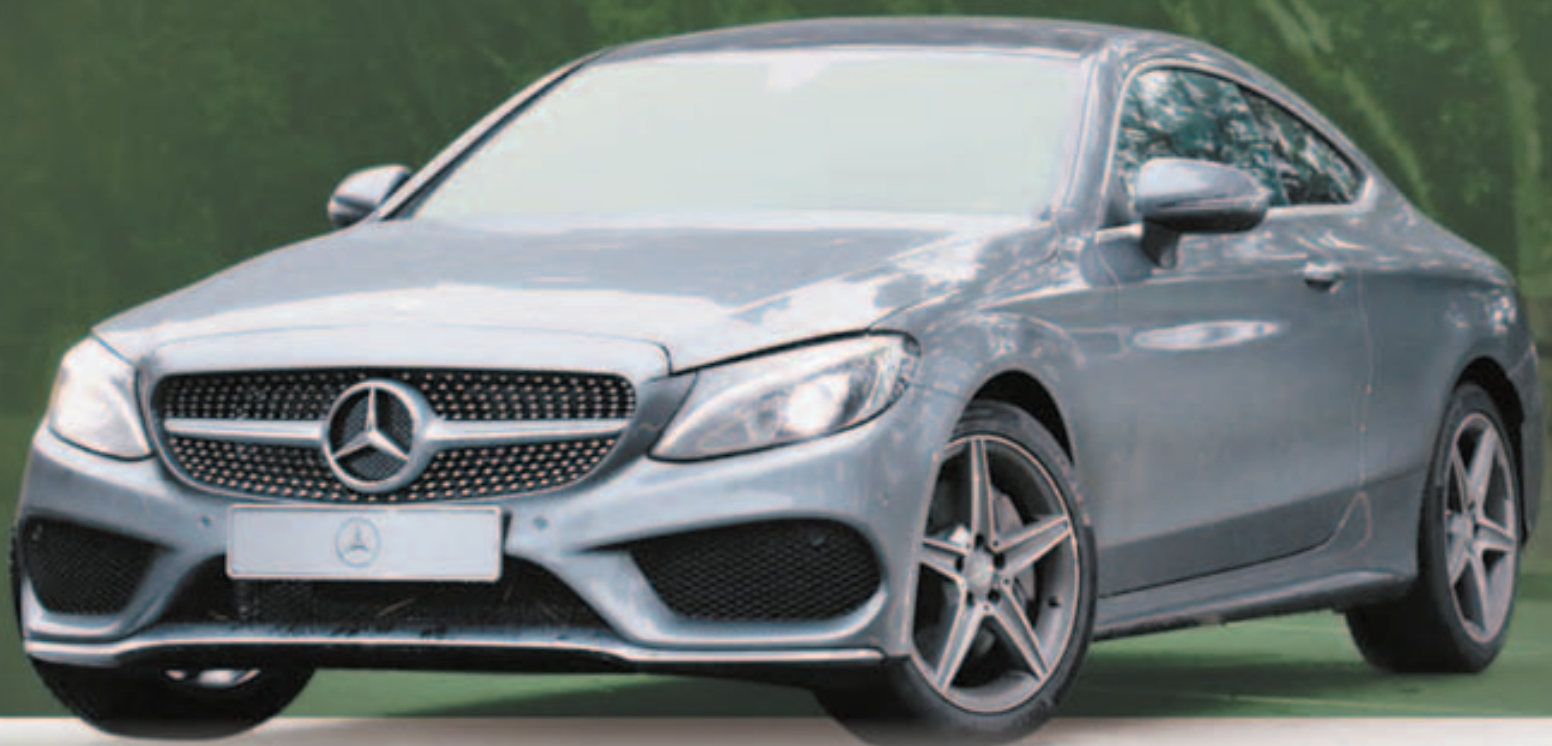
整体线条设计豪华贵气而且更具动感，假若不考虑四门进出便利，Coupe 版会是首选。