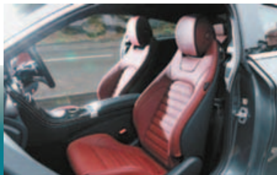
跑车化真皮座椅，设有四角度调校及腰部承托调校功能。