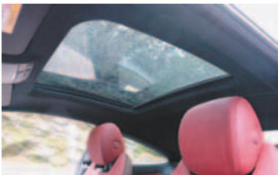
特大玻璃天窗横跨 A、B 柱之间，让空间感觉更加开阔。