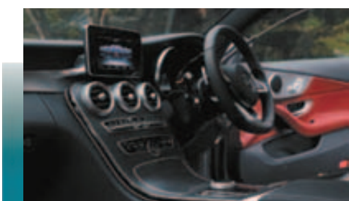
喜欢新世代平治车厢设计，处处流露出线条美感。