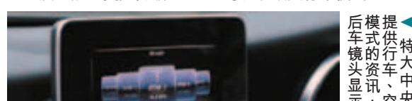
推拉 DYNAMIC 按键便可轻易改变行车模式。