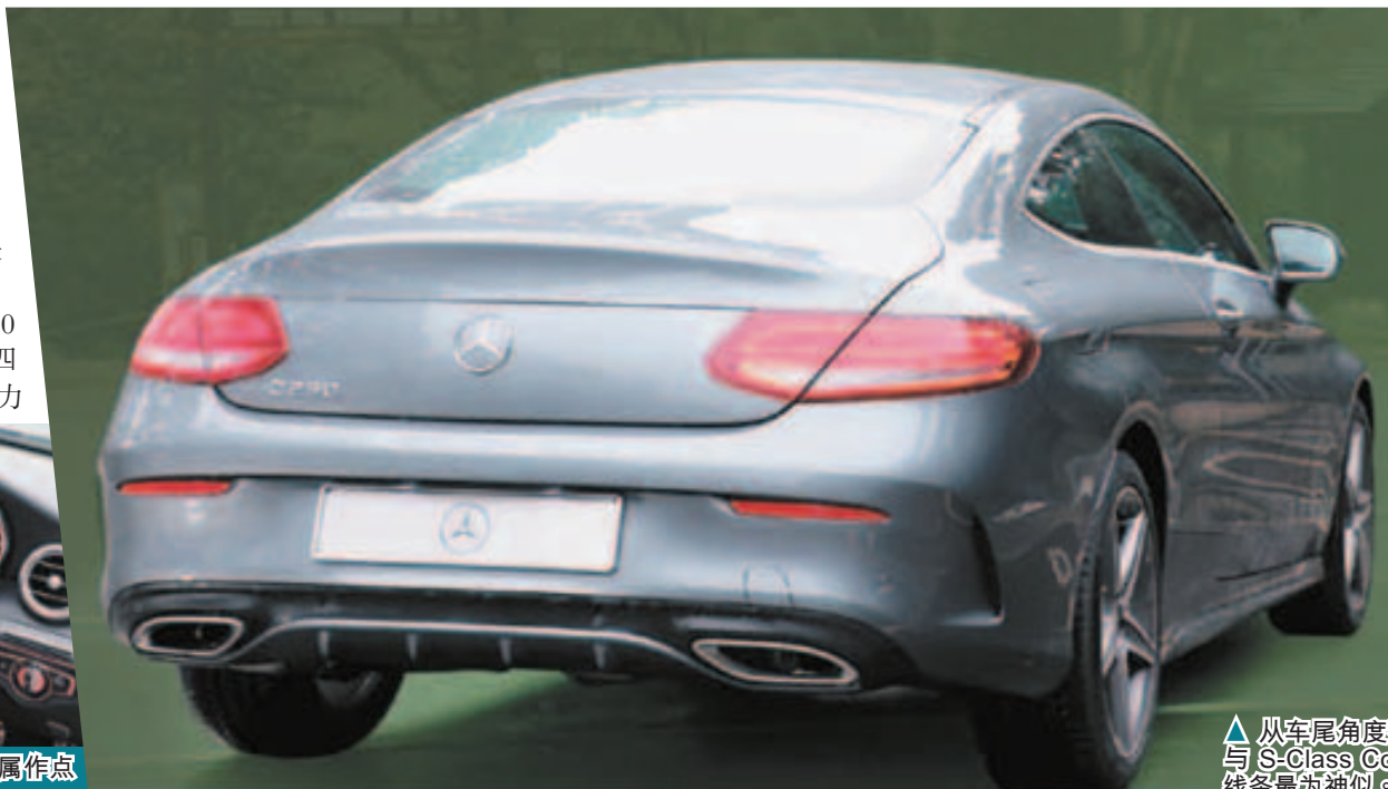
从车尾角度看，与 S-Class Coupe 线条最为相似。