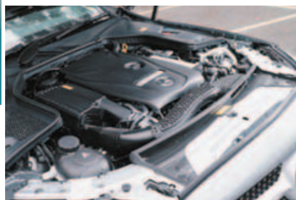
直列四汽缸 Turbo 引擎最大马力二百一十一匹，动力表现强劲，足够山路驰骋。

相信任何人都都会认同全新的 C-Coupe 很美，能够与意大利设计互相媲美。上一次接触 C-Coupe 是于车展内，原来在户外，线条感觉更有立体感，拍摄当日虽然时晴时雨，还飘着薄薄的雾气，虽然受到光线的影响，但亦阻止不到全新 C-Coupe 所散发出来的光芒。