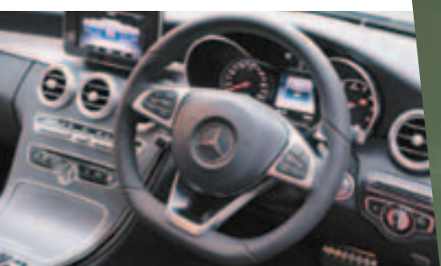
配备三幅式多功能软环，软环用上金属作点缀，还用三款皮革来缝制，握感出色。