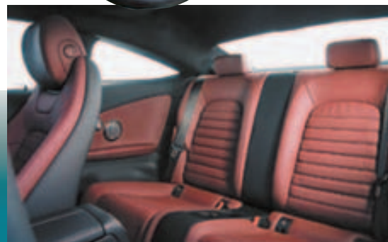
后排座椅虽不能以宽敞来形容，但以笔者一米八六高度来说亦不会感到局促。