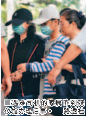
遇难司机的家属昨到殡仪馆办理后事。

大陆环球网发表评论，批评大陆赴台游事故率、死亡率「高得离谱，台湾相关部门要负很大责任」，如果不反思整顿，大陆客再赴台就等于去「玩命」，赴台游数量一定会进一步减少。