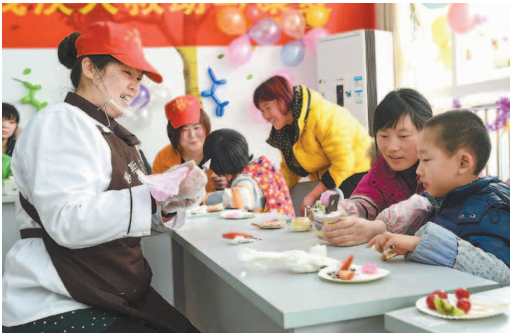
■ 阿斯伯格综合征与孤独症同属于广泛性发育障碍。图为安徽合肥志愿者和患有孤独症的孩子一起做蛋糕。

很多患有阿斯伯格综合征(AS)的孩子异常聪明,或者在某些方面表现得特别突出,但他们却不懂得如何跟人打交道。社会缺乏对他们的了解,他们往往成为不受欢迎的对象。离开学校或压抑自己,是不少阿斯伯格综合征患者的无奈选择。异于常人的聪明,对他们来说却是一种负担。