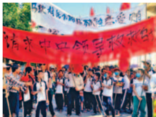
乌坎村民昨天继续游行示威。