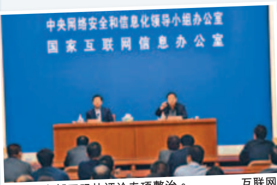
网信办部署跟帖评论专项整治。

对此新规，有网友感到风声鹤唳，「媒体姓党，评论也得姓党」。也有网友不满「以后乾脆禁止看帖、禁止上网了」「不评论怎么知道人民群众深恶痛绝？」