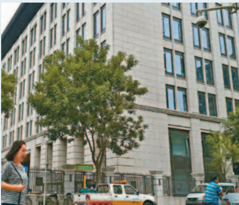
位于车公庄的网信办大楼共有八层，即将竣工。