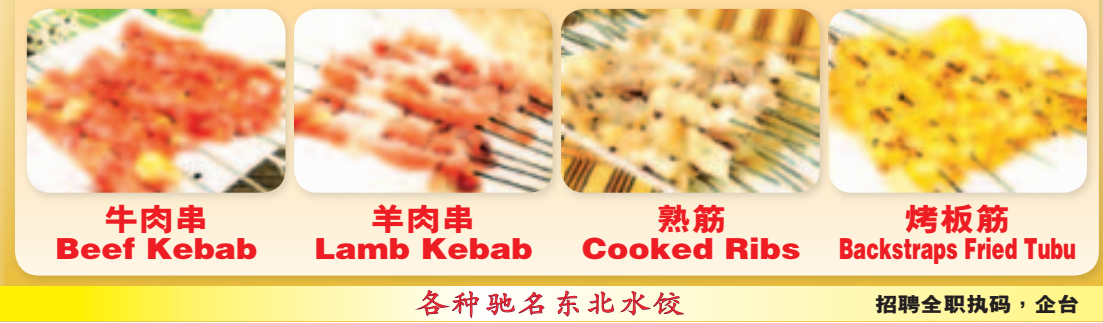
牛肉串 Beef Kebab 羊肉串 Lamb Kebab 熟筋 Cooked Ribs 烤板筋 Backstraps Fried Tubu