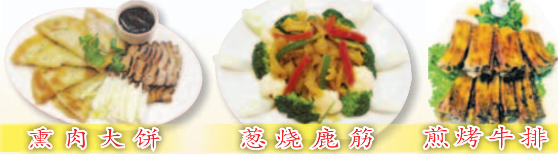
熏肉大饼 葱烧鹿筋 煎烤牛排