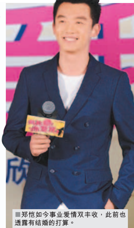
郑恺如今事业爱情双丰收，此前也透露有结婚的打算。

除了《奔跑吧兄弟》，郑恺和刘诗诗主演的新剧也正在热播。谈及关于青春片的自我感受，他认为，青春片就是要有遗憾、悔过和追忆。剧中的肖小军勤劳、能干、聪明、善变通，赢得了不少观众的点赞。人们不禁好奇，郑恺本人的生意头脑怎么样，他也爽快透露，自己在投资理财方面「最大的心得是不买基金和股票」。