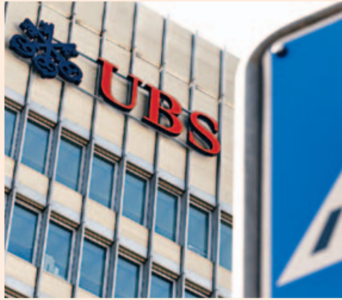
有指瑞银近周先后裁减本港及新加坡的人手。 资料图片

投行首季信贷及证券部门收入分别减少62%与47%;其他部门的表现亦叫人失望,去年表现亮丽的股票业务,首季亦按年下跌20%至117亿美元。首季市况波动,投资者风险胃纳减少,期间的负责新股报的股本市场活动更大跌58%至11亿美元。