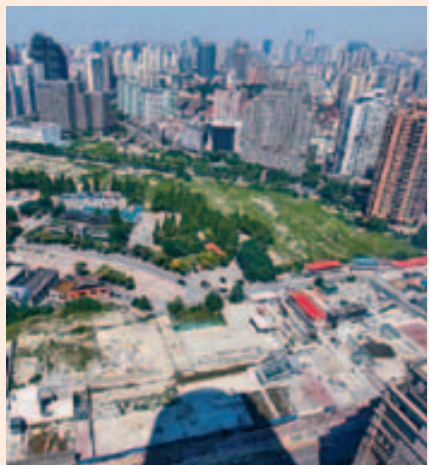
为遏止地价过热,苏州对部分地皮出让价格设定最高报价。 资料图片