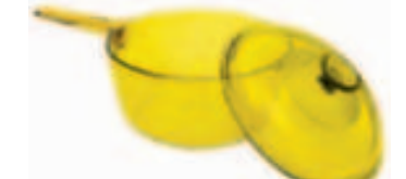
Visions 1.5L 玻璃煲 原价$70 特价$59.50

(Cooking with VISIONS is visibly better in every way - easier, healthier, tastier and better value with VISION you cook with confidence, control and style)