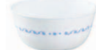
Corelle 28安士大碗 (指定款式) 原价$6.50 特价$4.95