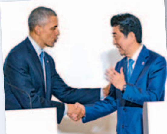
奥巴马昨于志摩市与安倍见记者,表明美方将配合调查冲绳女子遭美军人员奸杀案。