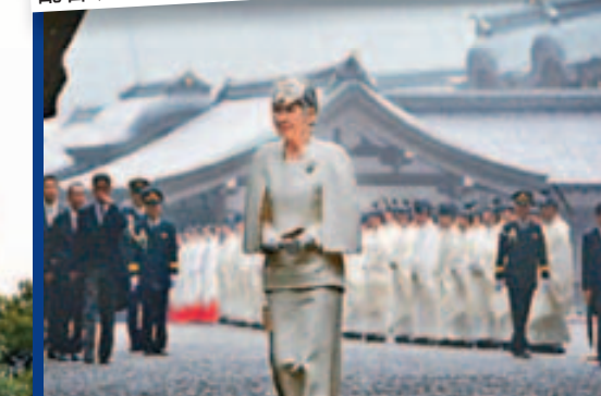
日本皇后美智子二〇一四年三月到伊势神宫参拜。