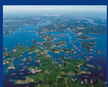
峰会会场所在的英虞湾拥有逾六十座岛屿,景色如画。中央社

早于上周六在日本仙台举行的G7财长和央行行长会议,七国已就不少议题暴露出存在难以弥合的分歧。该会议对汇率波动,以至关键性的扩大财政支出