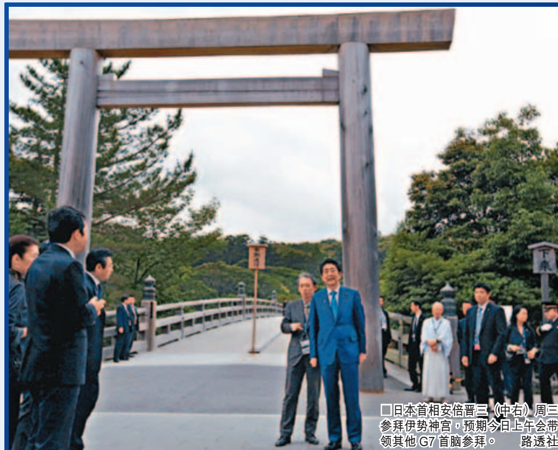
日本首相安倍晋三(中右)周三参拜伊势神宫,预期今日上午会带领其他G7首脑参拜。

美国总统奥巴马周三已结束越南的访问行程,转往日本三重县。他和安倍原定周四举行的双边会谈,因为冲绳反美军基地情绪高涨,提前在周三晚举行。奥巴马将于周五造访二战时遭核爆的广岛。